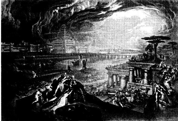
Abb. 5: Der Fall Babylons.

die Vorzeichenkunde, die Omenschau. Ezechiel, der Prophet am Beginn des babylonischen Exils der Juden, verweist darauf, wenn er den Heerzug Nebukadnezars II., das »Schwert des Königs von Babel«, beschreibt: