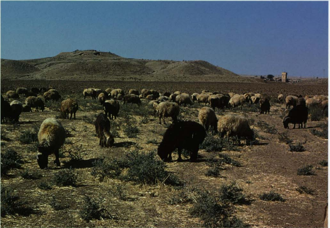
Abb. 4: Viehzucht und Ackerbau ergänzen sich in den kargen Landschaften Obermesopotamiens: hier eine Schafherde auf abgeernteten Getreidefeldern vor dem Ruinenhügel Tell Beydar in Nordsyrien.

Der verantwortliche General an dieser Mauer beklagt sich in einem Brief an König Sulgi, dass er die Truppen nicht gleichzeitig für den Krieg gegen die Amurriter wie zur Instandhaltung der Mauer aufbieten kann. Einleitend preist der General aber den König, dass der durch den Schutz der Mauer etwas für alle Menschen seines Reiches geschaffen habe: