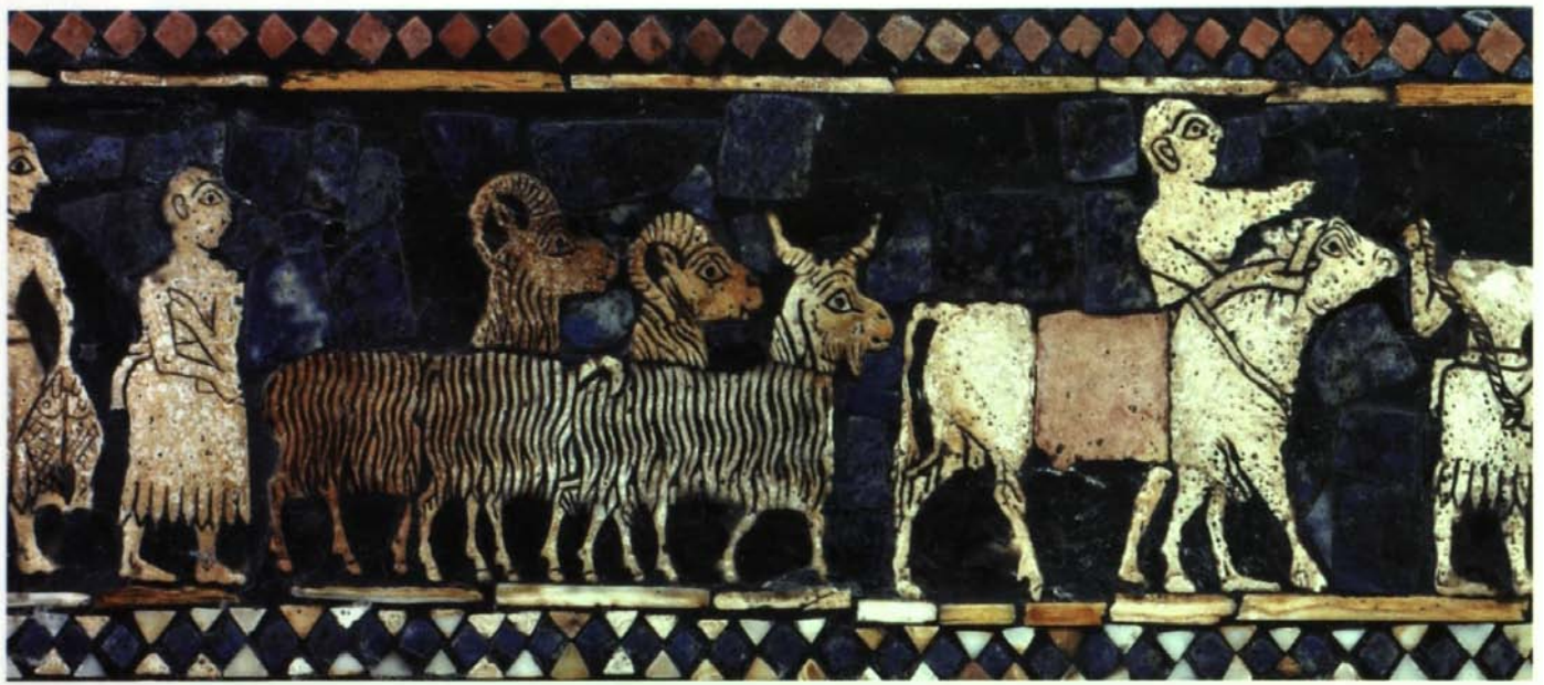
Abb. 3: Schafe, Widder und eine Kuh auf der sog. Mosaikstandarte von Ur. Fröhsumerisch, 2500–2350 v.Chr. Seite A, Lapislazuli, Kalkstein und Muscheln auf Holz. London, The British Museum.

König erst die Grenzen gesichert, bevor er es wagte, die Güter außerhalb der politischen Hauptstadt zu stationieren? Denn die königliche Verwaltung betraf vor allem die direkt der Krone unterstehenden riesigen Herden an Rindern und Schafen, die zu meist aus Kriegsbeute, Tributen und Abgaben ergänzt wurden.