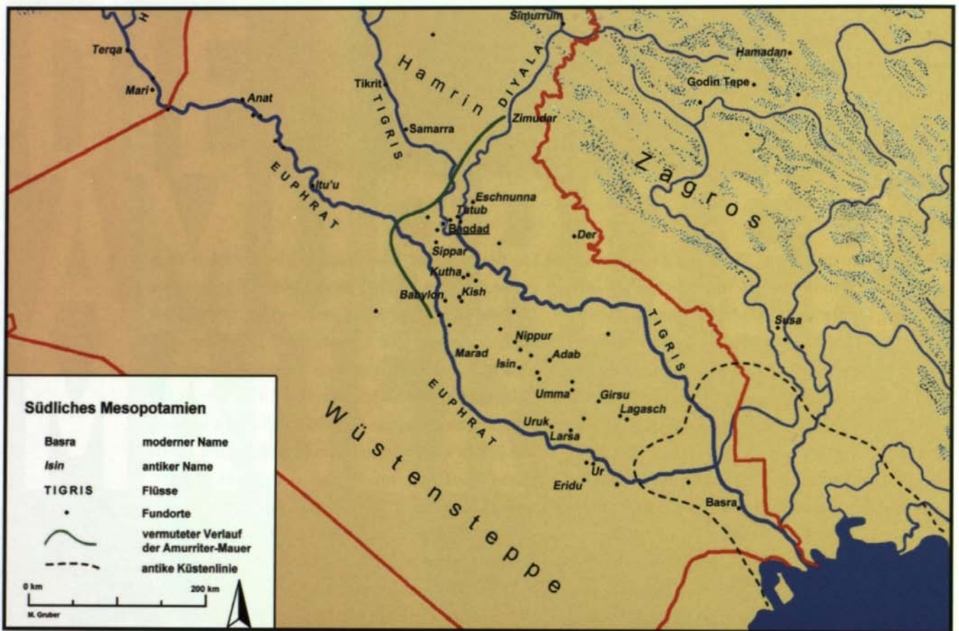
Abb. 1: Karte des südlichen Mesopotamien.

umgekehrt waren sehr wohl auch Einfälle aus den Bergländern im fruchtbaren Tiefland zu befürchten.