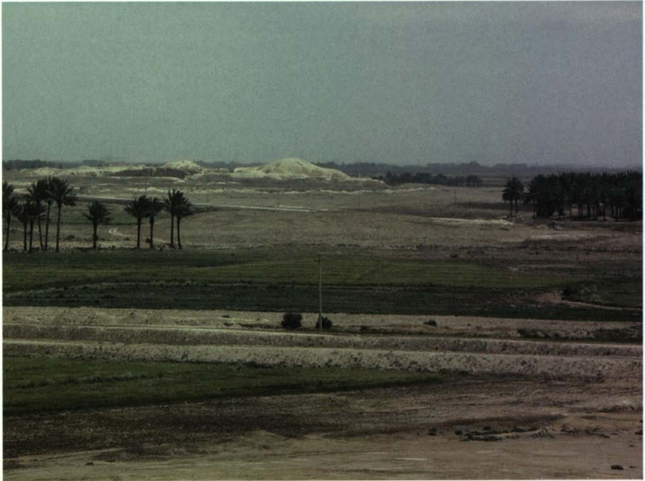
Abb. 2: Die antike Stadt Kisch liegt etwa 15 km östlich von Babylon und besteht aus mehreren Hügeln. Auf dem Bild sieht man inmitten von Feldern und Palmenhainen den Hügel Inghara. Früher lag Kisch an einem Arm des Euphrat, heute gibt es nur künstliche Bewässerung. Im Hintergrund sieht man ebenfalls Palmenhaine. So kann man sich die Landschaft in etwa vorstellen, in der die sesshaften Bauern im 3. Jt. v. Chr. lebten.

Sulgi, der zweite König der Dynastie aus Ur (2092–2045 v. Chr.), die wir nach der Abfolge der Sumerischen Königsliste die »Dritte Dynastie« von Ur nennen, benannte sein 37. Jahr, 2056 v. Chr., nach folgendem Ereignis: